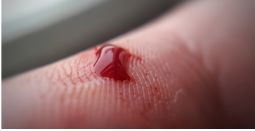
Die sogenannte Blutgerinnung sorgt dafür, dass Wunden aufhören zu bluten, Bild: erstellt mit Canva

Open Science > Medizin - Mensch - Ernährung > Warum Blutungen normalerweise stoppen