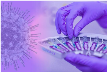
Die Tests von Genspeed erlauben eine rasche Infektionsdiagnostik und Bestimmung des Immunstatus, Bild: Pixabay, CC0

Open Science > Medizin - Mensch - Ernährung > Genspeed: patentierte Schnelltests erlauben rasche und zuverlässige Diagnostik