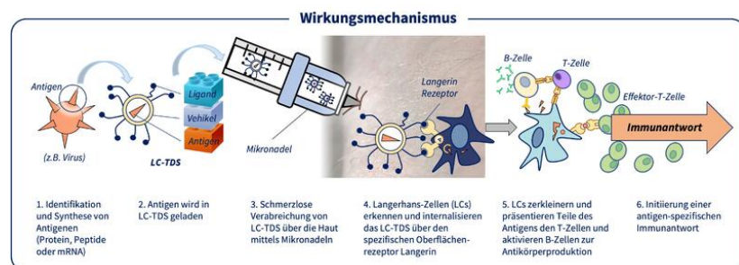
Abbildung 2: Mechanismus der Immunaktivierung durch LC-TDS, Bild: Cutanos

Die neue Cutanos-Technologie könnte in Zukunft vielseitig einsetzbar sein: Je nachdem, ob dadurch das Immunsystem aktiviert oder Toleranz induziert wird, sind verschiedene Anwendungen denkbar. Im Fall einer Immunaktivierung könnte das LC-spezifische Liefersystem durch die Aktivierung von B- und T-Zellen beispielsweise antivirale Impfstoffe oder Krebstherapien ermöglichen (siehe Abbildung 2).